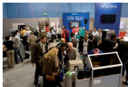
Die auf dem DVS GSI Messestand vorgestellten Schweißtrainer waren ein absoluter Besuchermagnet

gen war, die Jugendlichen bei der Aneignung der Systeme zu beobachten und deren Erfahrungen zu sammeln.