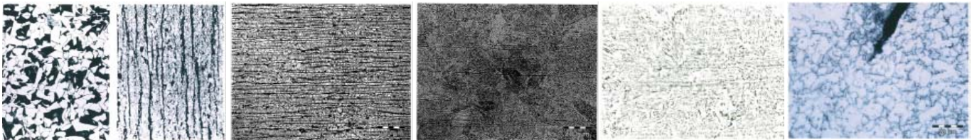
Abb. 1: „klassisch“ normalisierter unlegierter Baustahl, Festigkeitsklasse S355, li.: normalisiert; re.: normalisierend gewalzt