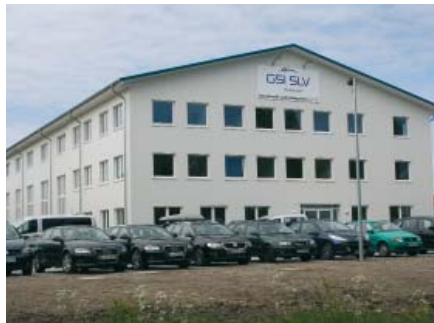
Das neue Bildungszentrum in der Flutstraße

Nach weniger als einjähriger Bauzeit wurde das Bildungszentrum Wilhelmshaven, das unter der Regie der SLV Hannover geplant und fertiggestellt wurde, eingeweiht. Rund 150 geladene Gäste folgten der Einladung der SLV Hannover nach Wilhelmshaven.