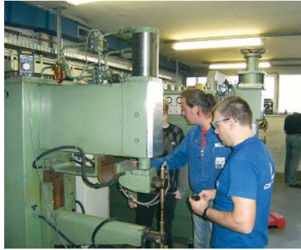
Widerstandsschweißlabor der SLV Fellbach

Fachkräfte für das Widerstandsschweißen von metallischen Werkstoffen bekommen mit diesem Lehrgang die bestmögliche praktische und theoretische Ausbildung und Qualifizierung. Gerade deswegen ist dieses Qualifizierungsangebot der SLV Fellbach für den Wirtschaftsstandort Baden-Württemberg mit der starken Automobilindustrie, vielen Automobilzulieferern und einer großen Anzahl von Blech verarbeitenden Betrieben für einen