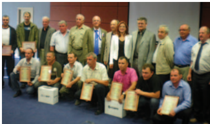
Teilnehmer des Schweißerwettbewerbs im Sept. 2011

Das Netzwerk GSI und DVS unterstützte das NAKS-Attestierungszentrum aus Rostov, Russland, bei der Ausrichtung eines Wettbewerbes für schweißtechnische Fachkräfte. Die 22 Teilnehmer aus 9 Unternehmen des Metall- und Stahlbaus und der Energietechnik aus der südlichen Region Russlands verfügten über eine mindestens 5-jährige Berufserfahrung im Schweißen, die sie an zu schweißenden