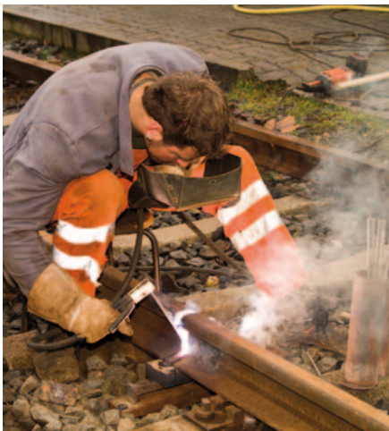
Lichtbogenhandverbindungsschweißer mit Stabelektrode OEV im Gleis

Betroffen sind von diesen Änderungen im Bereich Oberbauschweißtechnik alle deutschen Fachfirmen Oberbauschweißen gem. Ril 826.1020, die schon in den Niederlanden arbeiten und hierbei das Verfahren Aluminothermisches Gießschmelzschweißen ausführen oder dieses zukünftig anstreben.