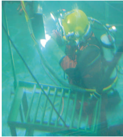
Unterswasserschweißer bei der praktischen Prüfung (DIN EN ISO 15618-1)

Durch die Anerkennung der DVS-Richtlinie 1801 sind zurzeit der GL und die SLV Hannover als anerkannte Stellen für die Betriebsprüfungen und Ausstellen der Herstellerqualifikationen benannt.